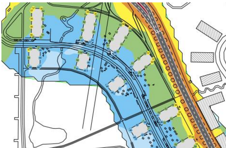
Figur 2. Norra delen av planområdet. Gemensamma uteplatser kan placeras på mark inom blått område.

Riktvärden för buller på uteplats på balkong överskrider generellt för bostadshus belägna närmast Peter Laestadius väg. Det är därför lämpligt att tillskapa gemensamma uteplatser på gård. Uteplats kan utan bullerskyddsåtgärd placeras inom blått område i bilaga AK01. Ett utdrag av denna bilaga visas i figur 2.