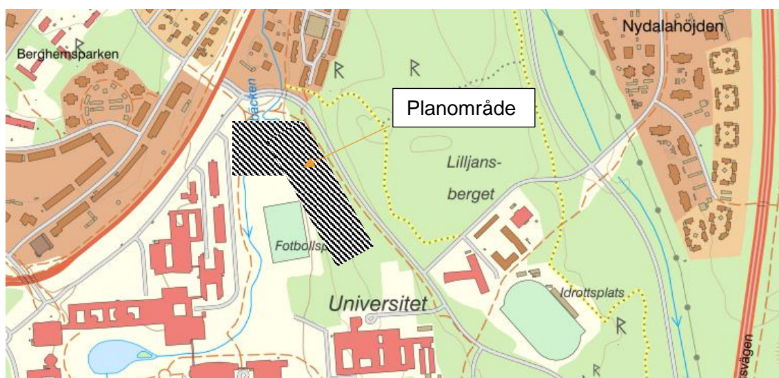
Figur 1. I figuren markeras planområdet översiktligt.

På och omkring Lilljansberget i Umeå planeras för bostäder på båda sidor om Petrus Laestadius väg. I denna rapport redovisas resultat från beräknat avseende bostäder söder om Petrus Laestadius väg, se i figur 1.