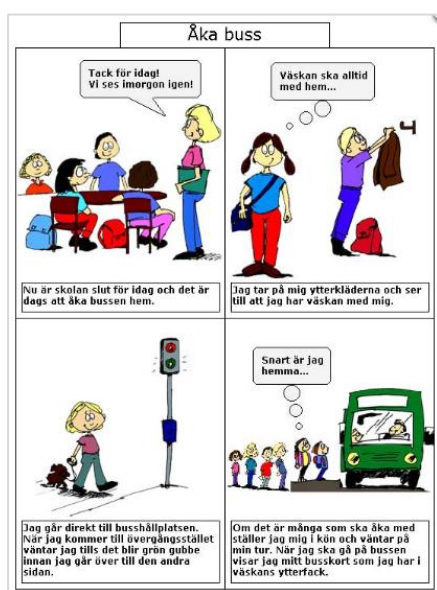
Exempel från Hedevåg Pedagogik

När du vet vilka situationer som kan bli svåra för eleven/eleverna går det också att förebygga problemsituationer genom planering – att ligga steget före.