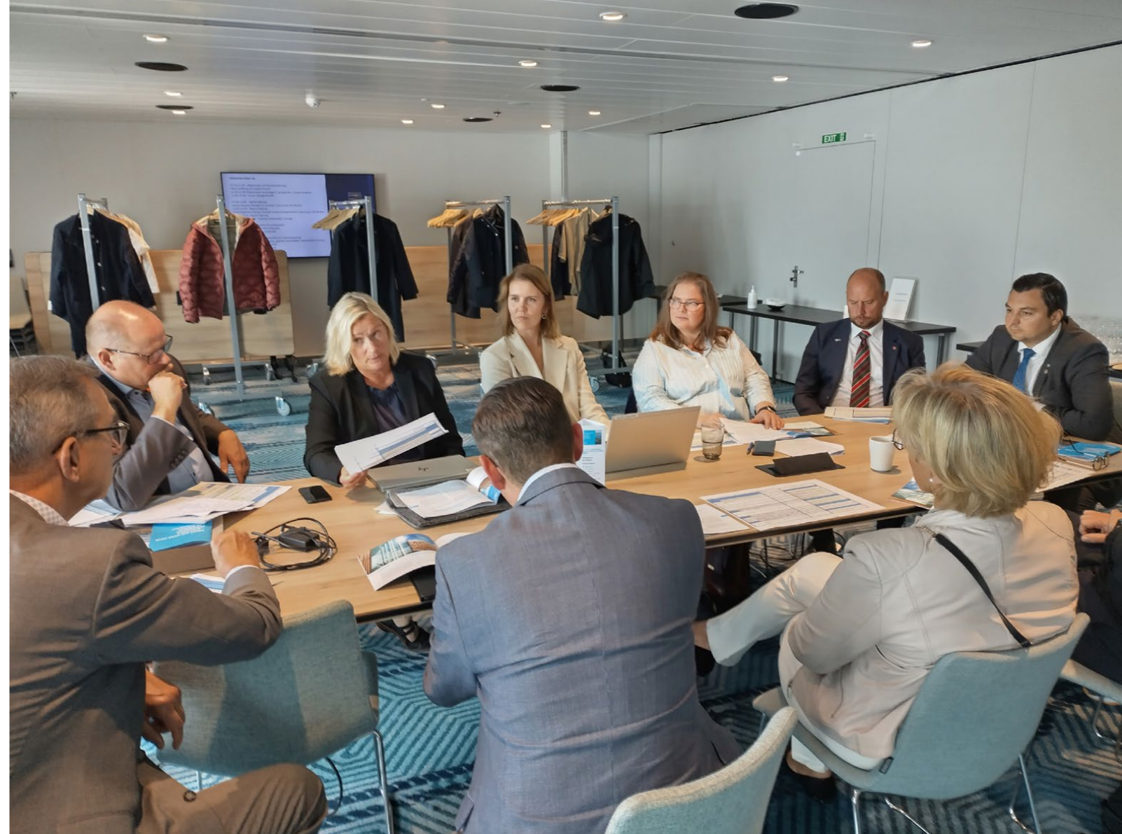
Fokusområde 1 utvecklar näringslivssamarbetet tillsammans med förtroendevalda under strategi kick-offen på Aurora Botnia 7.9.2023

Umeås och Vasas koncernbolag har genomfört matchmaking aktiviteter mellan våra koncernbolag, där tanken varit att börja med energibolagen och infrastrukturbolagen. Det gemensamma driftsbolaget Kvarkeports är samägt och där har en långsiktig strategi tagits fram. Umeå Kommunföretags infrastrukturbolag INAB, har besökt sina kollegor i Vasa och även energibolagen i Vasa och Umeå samt de i Skellefteå, Örnsköldsvik, Karleby och Jakobstad har mötts för att hitta gemensamma innovationsprojekt.