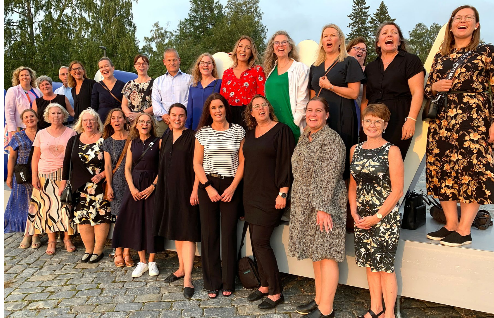
HR-avdelningarnas personal träffades i Vasa 17-18.8.2022

Både Umeå och Vasa har uttryckt en önskan om att vara med i det Kvarkenrådsprojekt som nu formuleras med behovsanalys, mål-