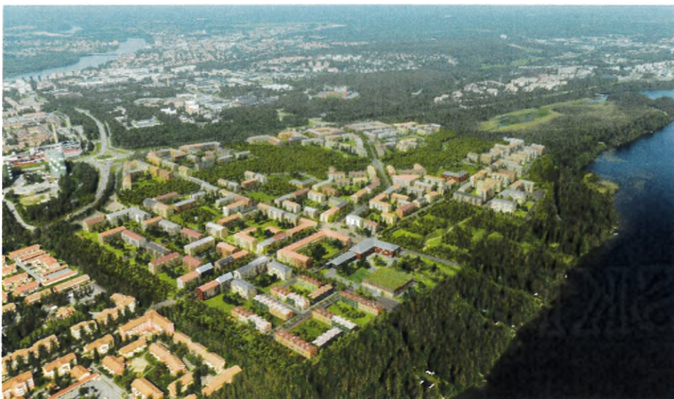
Illustration över Tomtebo strand, White arkitekter

Detaljplanen skapar planmässiga förutsättningar för utvecklingen av en ny stadsdel inom Umeå tätort. Planen bedöms följa huvuddragen i översiktsplanen, då planområdet enligt denna ska omvandlas till en blandad kvarterstad med hög täthet, där även Kolbäcken ska värnas i sin naturliga sträckning. Fokus har också legat på att skapa goda förutsättningar för hållbara resor genom att få till gena stråk för kollektivtrafik, fotgängare och cyklister samt jobba med mobilitetslösningar.