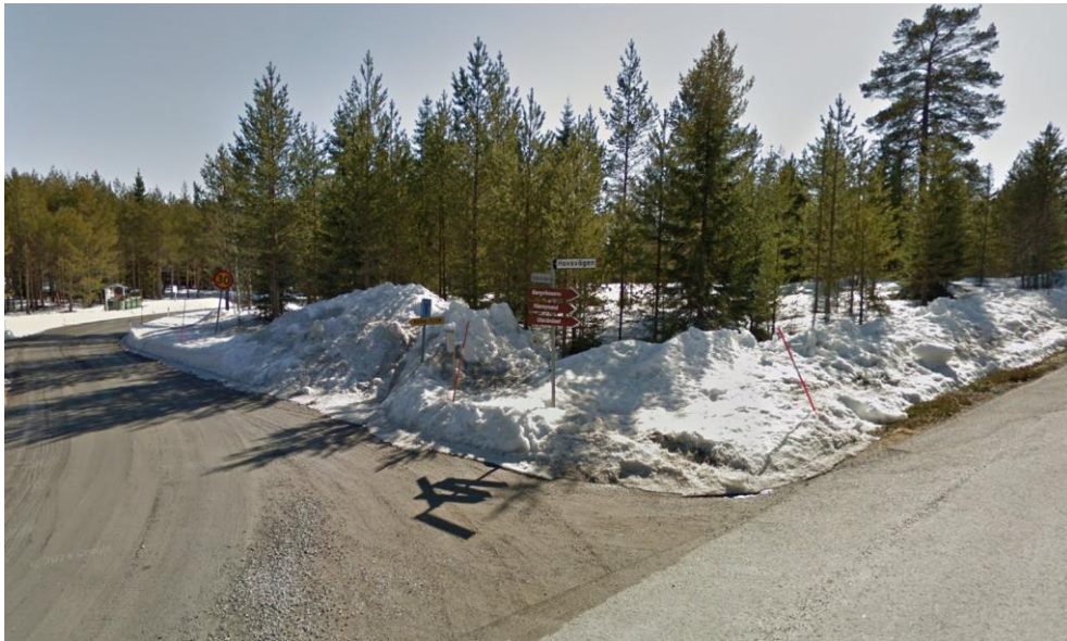
Området sett från korsningen Havsvägen/Västeråvägen